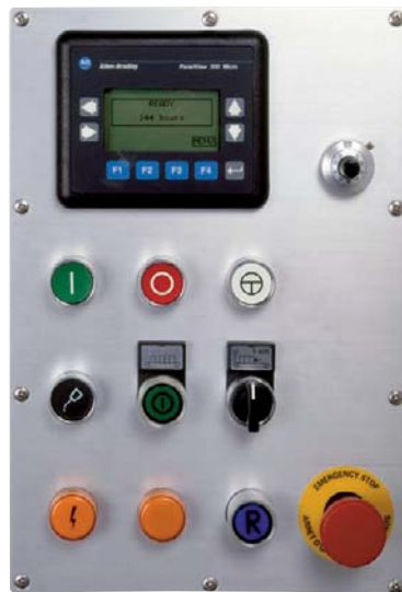
Bedienungselemente SFV 1200