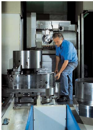
Computergesteuerte Produktionsanlagen für die hochpräzise Maschinenfertigung